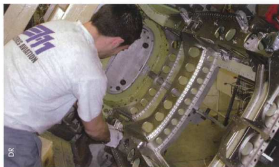
Assemblage de nacelle ATR, par la société Maz'Air.